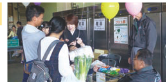
パルシステム埼玉 白岡センター 青空市に出店の様子

「プリユ葬」を実現するためには、思いを受け止め、理解し合えるパートナーが必要です。そこで、埼玉県内で活動している生協に理解ある葬祭会社が集まり、「葬祭事業協同組合 埼玉こすもす」を発足させました。以来、「パルシステム埼玉」の理念と思いを、「葬祭事業協同組合 埼玉こすもす」が受け止めて具体化し、安心なお葬式を施行しています。