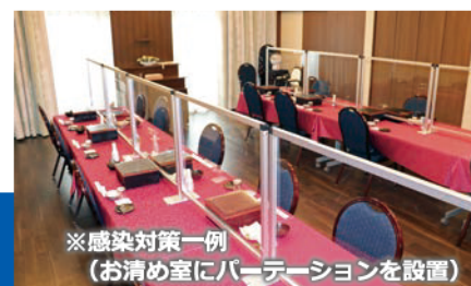
※感染対策一例 （お清め室にパーティションを設置）

コロナ禍でのご葬儀全般について適切なアドバイスをさせていただきます。 PN202110/113,300