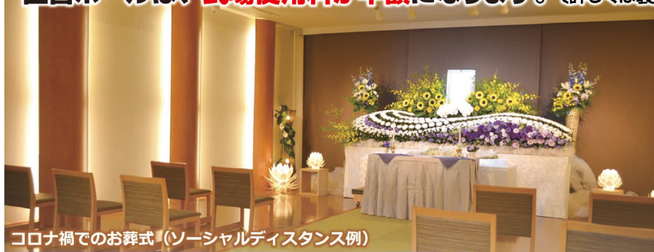
コロナ禍でのお葬式（ソーシャルディスタンス例）