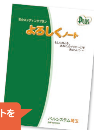
2020年4月リニューアルした「よろしくノート」

好評につき、引き続き資料請求で、プリユ葬オリジナルエンディングノートを資料と一緒に差し上げます。