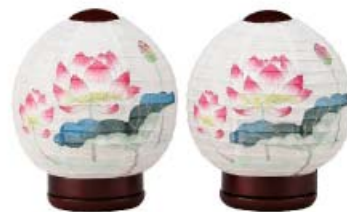
【提灯】ほのか華蓮対