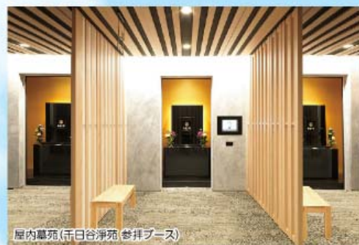
屋内墓苑(千日谷浄苑 参拝ブース)

【はせがわのおはかの窓口】では、お墓に関する様々なお悩み・疑問・ご相談に、お客様それぞれに合わせたご提案をしております。