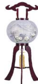
【提灯】 ひみつさんじゅうのとう 芙蓉三重塔 回転筒付