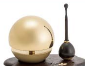
【リンセット】たまゆらリン