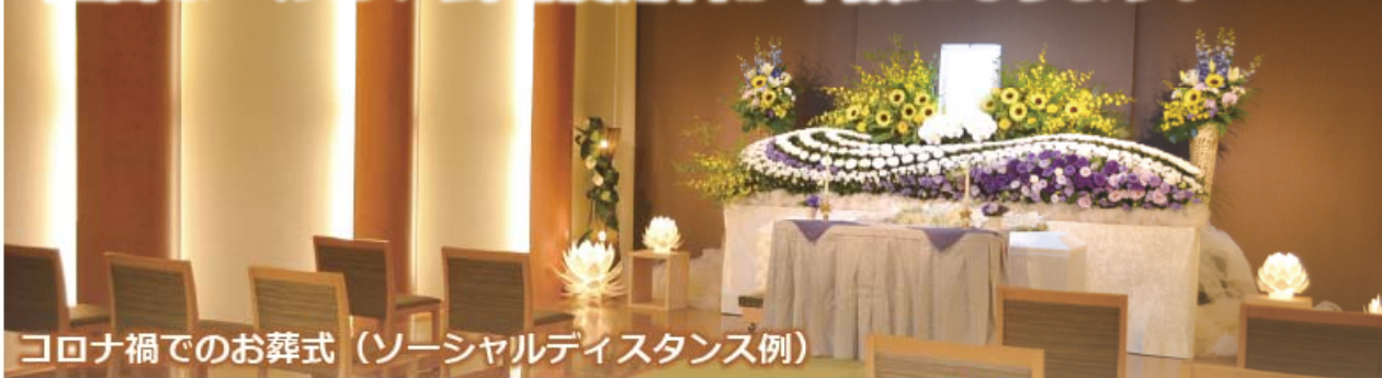
コロナ禍でのお葬式（ソーシャルディスタンス例）

◆基本プランのほかに、伝統的な葬送儀礼に沿った「一般葬」や、「自宅葬」「偲ぶ会」「無宗教葬」「海洋散骨」「樹木葬」など、それぞれのご希望をアレンジしたオリジナルなお葬儀も承ります。