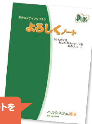
2020年4月リニューアルした「よろしくノート」

好評につき、引き続き資料請求で、プリユ葬オリジナルエンディングノートを資料と一緒に差し上げます。