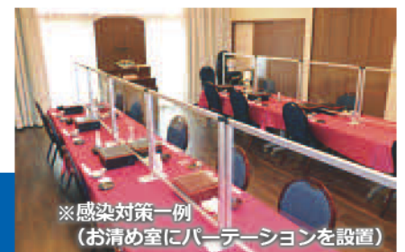
※感染対策一例（お清め室にパーティションを設置）

好評につき、引き続き資料請求で、プリユ葬オリジナルエンディングノートを資料と一緒に差し上げます。