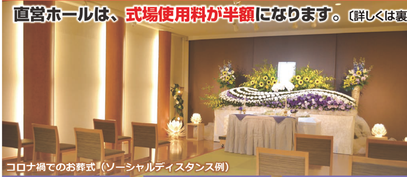
コロナ禍でのお葬式（ソーシャルディスタンス例）