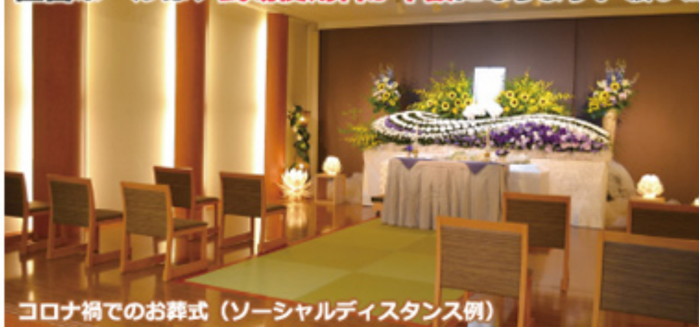
コロナ禍でのお葬式(ソーシャルディスタンス例)

◆基本プランのほかに、伝統的な葬送儀礼に沿った「一般葬」や、「自宅葬」「偲ぶ会」「無宗教葬」「海洋散骨」「樹木葬」など、それぞれのご希望をアレンジしたオリジナルなご葬儀も承ります。もちろん、ウィズコロナに対応したご葬儀の提案やご要望にもお応えいたします。